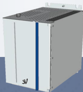
UNITA' CENTRALE WAVE